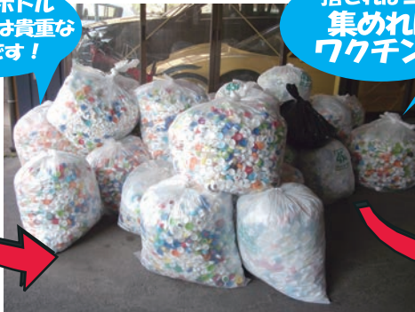
選別・確認をして指定袋に