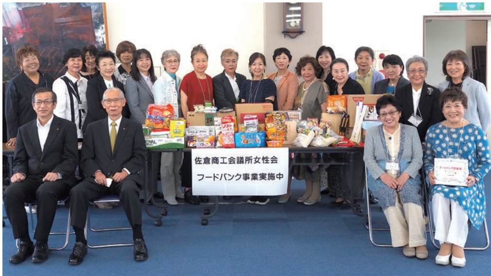
総会に出席した皆さんとフードバンク事業に寄せられた食品・寄付金