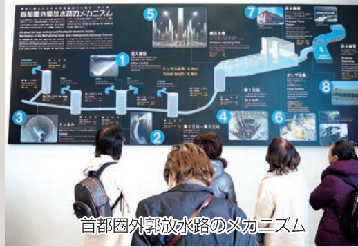
首都圏外郭放水路のメカニズム