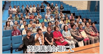
茂原講演会場にて

今回、久々に参加させていただきました。初体験の小湊鐵道のトロッコ列車では、ガタゴト、ガタゴト、振動とブレーキ音にびっくりしました。台風の被害にも負けずに月崎駅まで乗車。途中あちこちで台風の爪痕を見かけました。年々台風も大きくなり、自然災害の怖さを感じました。