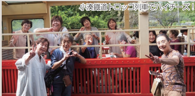
小湊鐵道トロッコ列車でハイチーズ!

今回、久々に参加させていただきました。初体験の小湊鐵道のトロッコ列車では、ガタゴト、ガタゴト、振動とブレーキ音にびっくりしました。台風の被害にも負けずに月崎駅まで乗車。途中あちこちで台風の爪痕を見かけました。年々台風も大きくなり、自然災害の怖さを感じました。